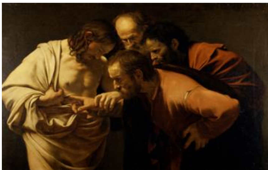
Bild: Caravaggio, Michelangelo Merisi da: Der Ungläubige Thomas In: Pfarrbriefservice.de